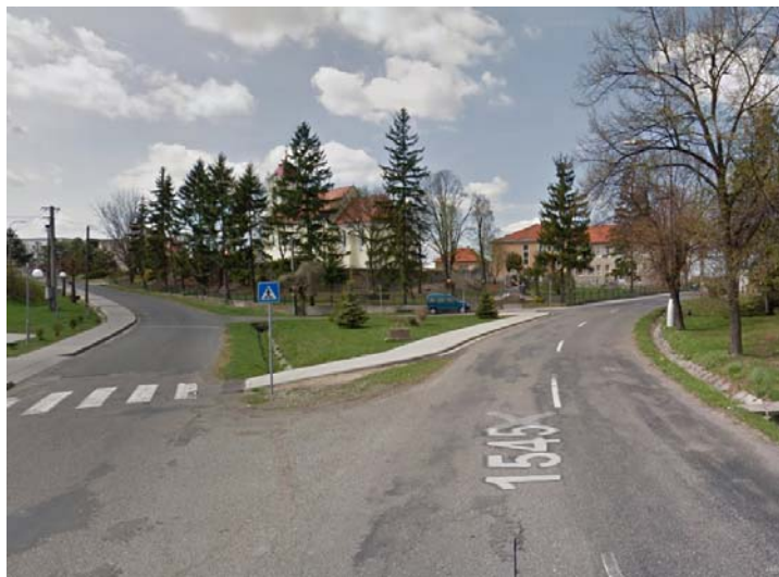
Obrázok 7: Farský kostol z Námestia SNP

Ako sme uviedli v predchádzajúcom texte, pre kontext pochopenia významnosti jednotlivých prvkov v krajine a možnosti ich interpretácie, je dôležitá ich vizuálna identifikácia a zachovanie prvku, ako dominanty. Národná kultúrna pamiatka farského kostola je samozrejme viditeľná z viacerých miest, vzhľadom však k ich lokalizácii za kľúčový pohľad považujeme lokalitu námestie SNP (obr. 7).