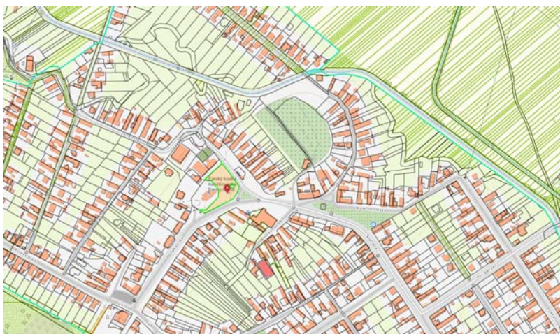
Obrázok 1: Lokalizácia predmetného priestoru v obci ( https://zbgis.skgeodesy.sk/mkzbgis/sk )

Analyzovaný krajinný priestor je lokalizovaný v intraviláne obce Starý Tekov a tvorí pomerne nerozľahlé, uzavreté územie v tesnej blízkosti farského kostola Nanebovzatia Panny Márie (obr. 1). Ide o kostolný areál rozkladajúci sa medzi opevňovacím múrom samotného kostola, stojaceho na neveľkom návrší v centrálnej časti obce, a cestami ulíc Námestie SNP a Tekovská (obr. 2, 3).