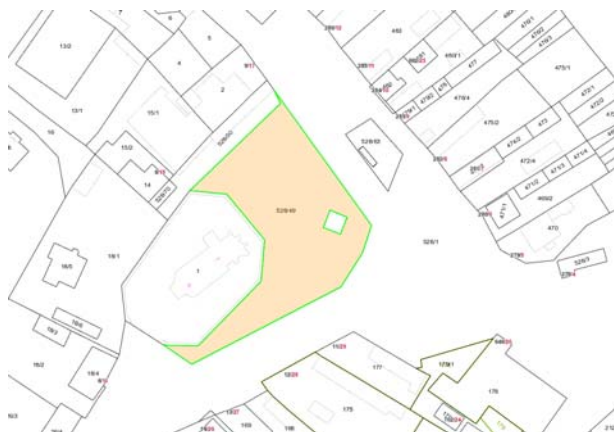
Obrázok 2: Rozsah predmetnej parcely ( https://zbgis.skgeodesy.sk/mkzbgis/sk )

Z geomorfologického hľadiska sa územie nachádza v Podunajskej pahorkatine podcelku Hronská niva. Územie je charakteristické rovinatým až zvlneným priebehom s nadmorskou výškou okolo 150-170 m n. m. Len lokálne sa dvíha o niekoľko metrov až desiatok metrov. Hovoríme hlavne vo vzťahu samotnej nive Hrona, kde je typické rovinaté územie s lokálnymi návršími, v tejto oblasti najčastejšie sopečného pôvodu. Tak to je aj