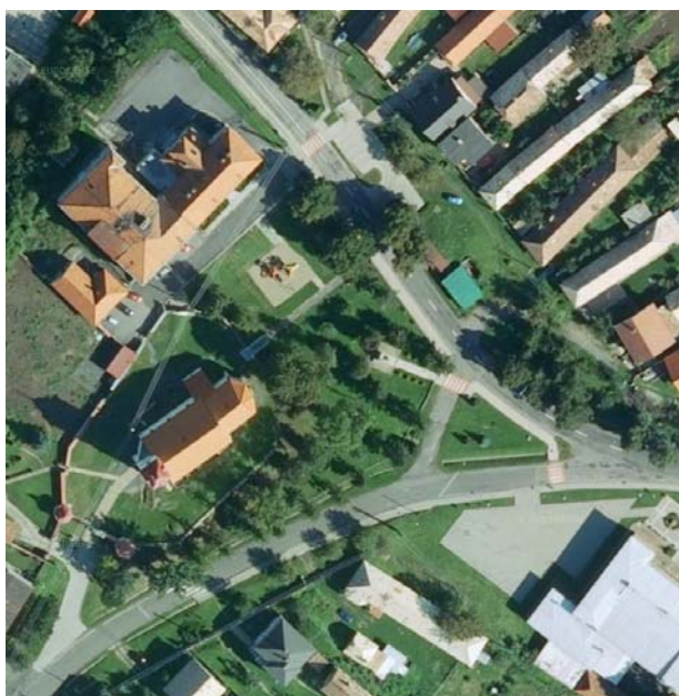
Obrázok 3: Situácia riešeného územia na leteckej snímke ( https://sk.mapy.cz/letecka )

Nadmorská výška tu presahuje 170 m n. m. čo je z hľadiska charakteru okolitých plôch viditeľnou terénnou dominantou. Návršie je v severo-južnom smere rozdelené cestou v úvaline – terénnej depresii – ktorá má pravdepodobne sekundárny pôvod. Uvedený priebeh terénu sa odzrkadľuje aj v usporiadaní parciel (obr. 2), kde je jasne viditeľné vymedzenie hraníc jednotlivých parciel (uvažovaného areálu a susedných pozemkov) podľa vrstevnicového priebehu.