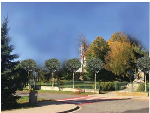
Obrázok 10: Vizuálny dopad náhradnej výsadby

5 m, má guľovitú korunu šírky 3-4 m. Na obrázku 10 pre názornosť uvádzame približný vizuálny dopad náhradnej výsadby. Použitie stromoradia tohto typu zvýrazní priebeh ulice, podčiarkne dôležitosť riešeného verejného priestoru a zdôrazní prítomnosť národnej kultúrnej pamiatky. Dispozíciu navrhovaného riešenia uvádzame na obrázku 11. Navrhujeme použiť 12 jedincov Tilia tomentosa 'Silver Globe' s obvodom kmeňa 1 m nad zemou pri výsadbe minimálne 14-16 cm.