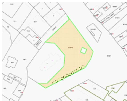
Obrázok 11: Dispozícia navrhovaného riešenia náhradnej výsadby

Realizáciou náhradnej výsadby navrhovaného druhu a charakteru sa prispeje k zachovaniu dôležitej charakteristickej črty krajine, resp. jej vizuálnej percepcie a interpretácie. Navyše verejný priestor námestia SNP v obci Starý Tekov bude vhodne dotvorený uličným stromoradiem, ktoré okrem svojich estetických bude plniť aj ostatné klimatické a ekologické funkcie.