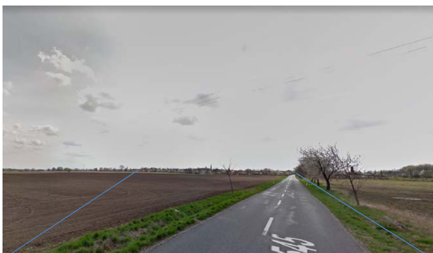
Obrázok 4: Vizuálna percepcia širšieho krajinného priestoru obce ( https://www.google.sk/maps/ )

Z vizuálne exponovaného priestoru (VEP) – chápeme ako entitu pre vyjadrenie lokality, z ktorej je vo vizuálnom kontakte predmetná lokalita (nazýva sa aj „point of view“), inak je VEP chápaný ako priestor viditeľný (exponovaný) – v tomto prípade (obr. 4) – severne od obce (rovina, štátna cesta III. triedy 1545), možno zachytiť severný horizont krajinného priestoru bez dominantných vrcholov.