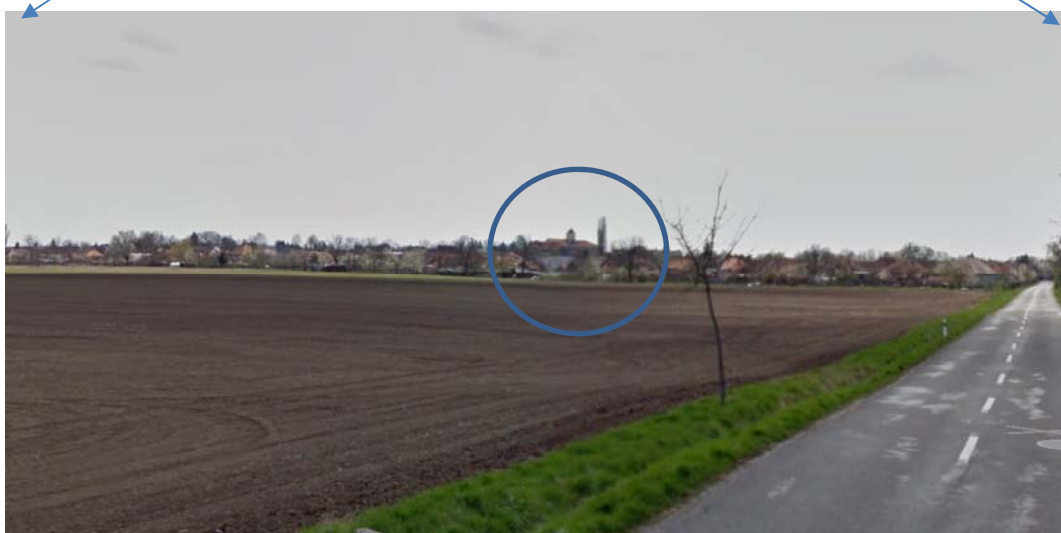
Obrázok 5: Vizuálna percepcia dominanty obce – farského kostola ( https://www.google.sk/maps/ )

Vizuálne pásmo je z južnej strany obkolesené horizontom dohľadnosti, ktorý vzhľadom k rovinnému priebehu terénu tvoria vegetačné prvky v extraviláne obce, resp. samotná obecná zástavba. Ako je vidieť vyššie (obr. 4, 5) jedinou markantnou dominantou obce a jej okolia z pohľadu na obec je spomínaný a riešený farský kostol. Z hľadiska charakteristických znakov krajiny je samozrejme ich súčasťou, avšak nie jediným, čo