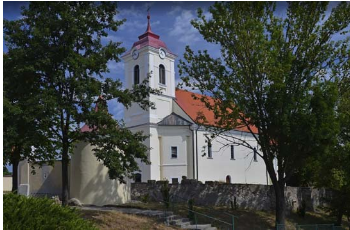
Obrázok 9: Farský kostol z ul. Tekovskej – priehľad - detail ( https://www.google.sk/maps/ )

Z ostatných lokalít v obci je kostol ako najdôležitejšia dominanta obce, neviditeľný, alebo viditeľný len minimálne v úzkych priehľadoch medzi zástavbou buď v uliciach alebo prevažne zo súkromných záhrad. Pre uvedené považujeme za najdôležitejšie, zachovanie vizuálneho kontaktu, čo možno najväčšieho rozsahu, z Námestia SNP.