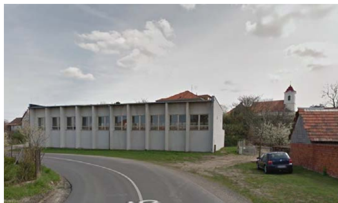
Obrázok 8: Farský kostol z ul. Družstevný rad

Na ďalších obrázkoch (8,9) a obrázkoch 6,7 ukazujeme, že práve „point of view“ Námestie SNP je pre vizuálnu percepciu kostola a jeho kontextu najdôležitejším. Rozhodujúcou je samozrejme aj dostupnosť priestoru odkiaľ sa na predmetnú pamiatku pozeráme aj možnosti odstavenia vozidla a pod.